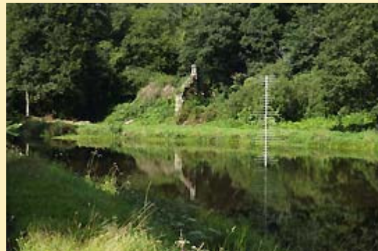
Christophe Litou, Réhabilitation d'une voie commerciale, 2008, (visuel de gauche) Cécile Le Talec, Vice et versa, pièce d'écho, 2008, (visuel de droite)