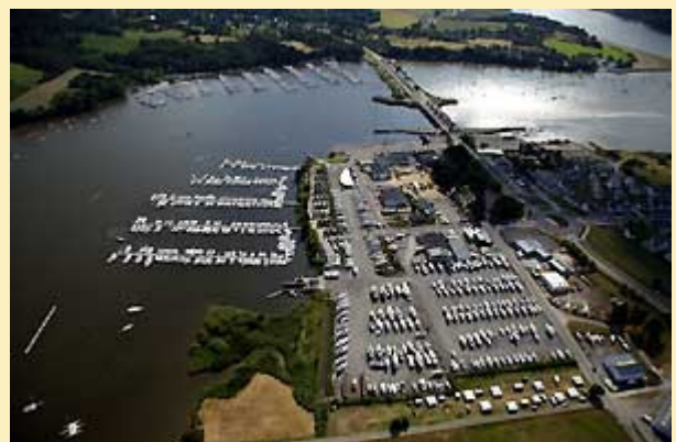
Port d'Arzal-Camoël : "Un pôle technique parfaitement équipé"

Le port d'Arzal-Camoël, situé à proximité immédiate du barrage d'Arzal-Camoël, dispose de 1 081 places à flot : 971 places sur pontons ou quais, dont 54 « visiteurs » ; 110 places sur corps-morts