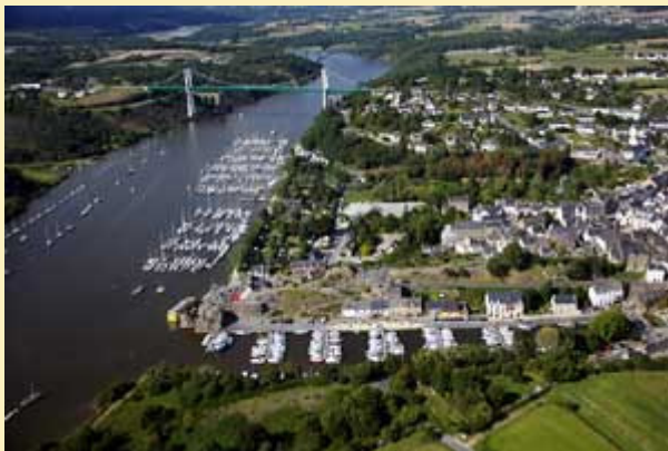
Port de La Roche-Bernard : "Une escale pleine de charme"

Le port de La Roche-Bernard est un port départemental concédé par le Conseil général du Morbihan au Syndicat Intercommunal de La Roche-Bernard – Férel - Marzan, et dont la gestion est assurée par la SAGEMOR (contrat de délégation de service public).