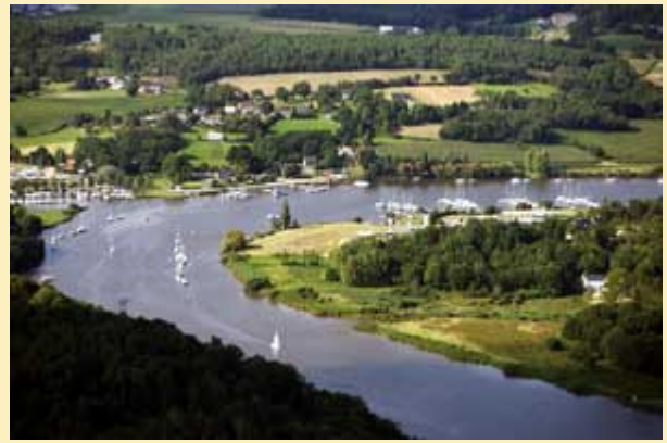
Port de Foleux : "un port à la campagne"