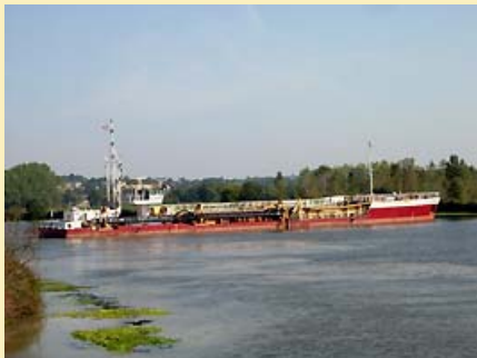
Navire ST GERMAIN à l'évitage (demi-tour) au-dessus de l'apportement sablier de Redon après déchargement

La compagnie de navigation possède 2 navires sabliers, le PAYS DE LOIRE et le ST GERMAIN qui travaillent à l'extraction de sable au large de l'estuaire de la Loire pour transporter et décharger le sable sur des installations sablières situées sur la Loire de St Nazaire à Nantes avec la particularité de remonter la Loire fluviale jusqu'à St Julien de Concelles. Au delà de Nantes avec le ST GERMAIN, et d'approvisionner notre filiale Sablières Redonnaises par la Vilaine jusqu'à Redon (dernière navigation commerciale de marchandise sur la Loire et la Vilaine).