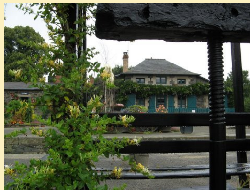
Ecluse du Comte