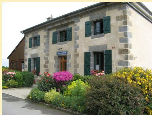
Ecluse de La Petite Madeleine

A chacun des 20 premiers classés un chèque et un bouquet de fleurs sont remis lors de la cérémonie des vœux de l'Institution. Cérémonie qui a eu lieu le 20 janvier dernier à Hédé.