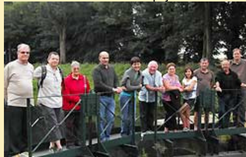
Balade contée aux étangs du Roz – Neulliac