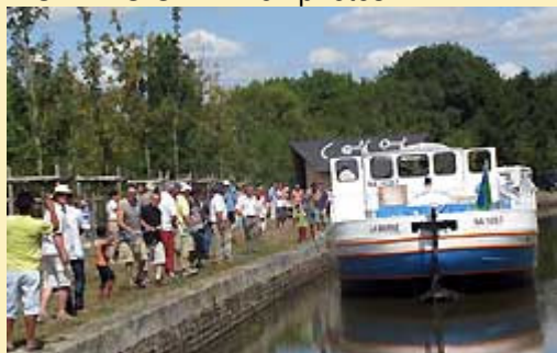
Visite de la Marne – Héric / Nort-sur-Erdre (OTEG)