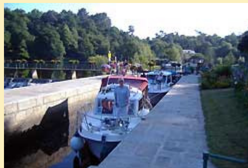
descente du Blavet