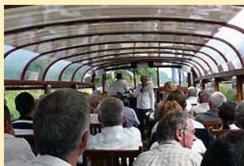
participation à l'inauguration de la station d'épuration de St Judoce